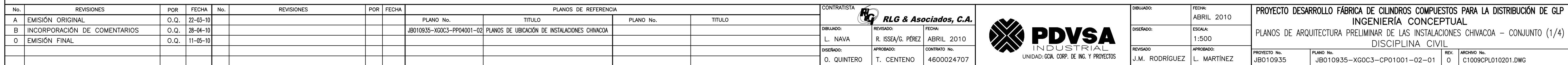
PLANTA GENERAL / REPARACIÓN DE CILINDROS METÁLICOS Y FÁBRICA DE RECUBRIMIENTO PLÁSTICO Y ENSAMBLAJE FINAL ESCALA: 1:500